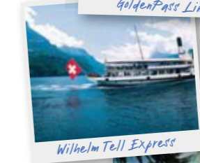
Wilhelm Tell Express

Luzern > Vierwaldstättersee > Flüelen > St. Gotthard > Bellinzona > Locarno/Lugano